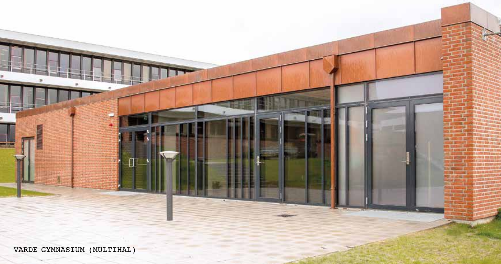
VARDE GYMNASIUM (MULTIHAL)